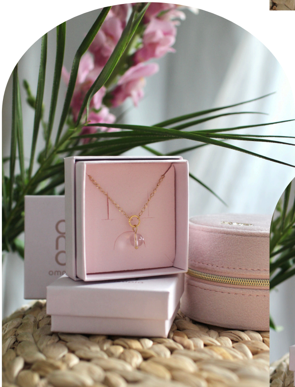
UPEA Juulia, kuulas