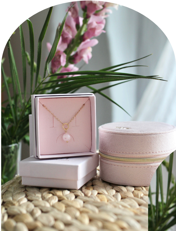
UPEA Juulia, ruusukvartsi