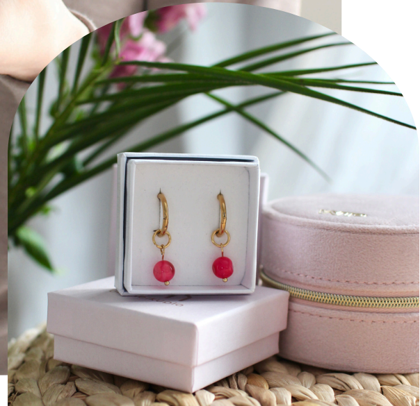
UPEA Juulia, cherry marble -kaulakoru ja korvakorut