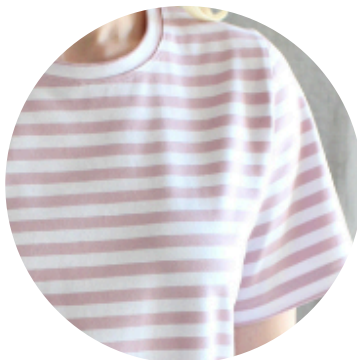
Hento vaaleanpunainen - valkoinen