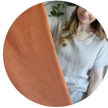
Kultahippu golden orange