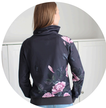
Belle, silver pink

Belle -kuosi on jo pitkään ihastuttanut erilaisilla materiaaleilla ja nyt tämä isompi raportti koko on myös verkkarina kahdessa sävyssä.