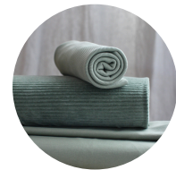
Dusty mint + dusty mintu