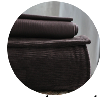
Suklaan ruskea + brownie