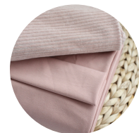
Powder + puuteri