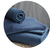
Blue jeans + blue jeans